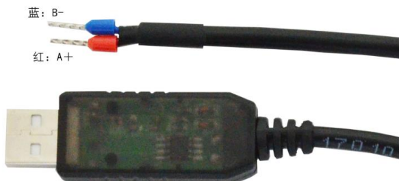
图 1：RS485 转 USB 连接线

需要的其他设备：24VDC 电源、RS485 转 USB 线、电脑，本公司提供的 RS485 转 USB 线如下图：