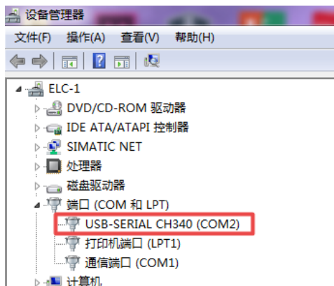
图 3 查看 COM 端口

从公司产品资料下载页下载 CH341SER 驱动软件，并根据提示安装。如安装成功，可在电脑的设备管理器端口中查看到，请记下相应的 COM 端口号，如图 3 所示：