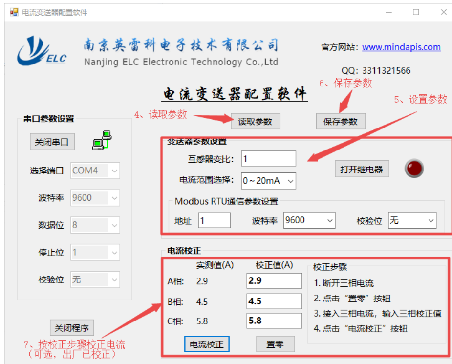
图 5 变送器参数修改

注：1、互感器变比设定范围：1~1000，Modbus 地址设定范围：1~247。