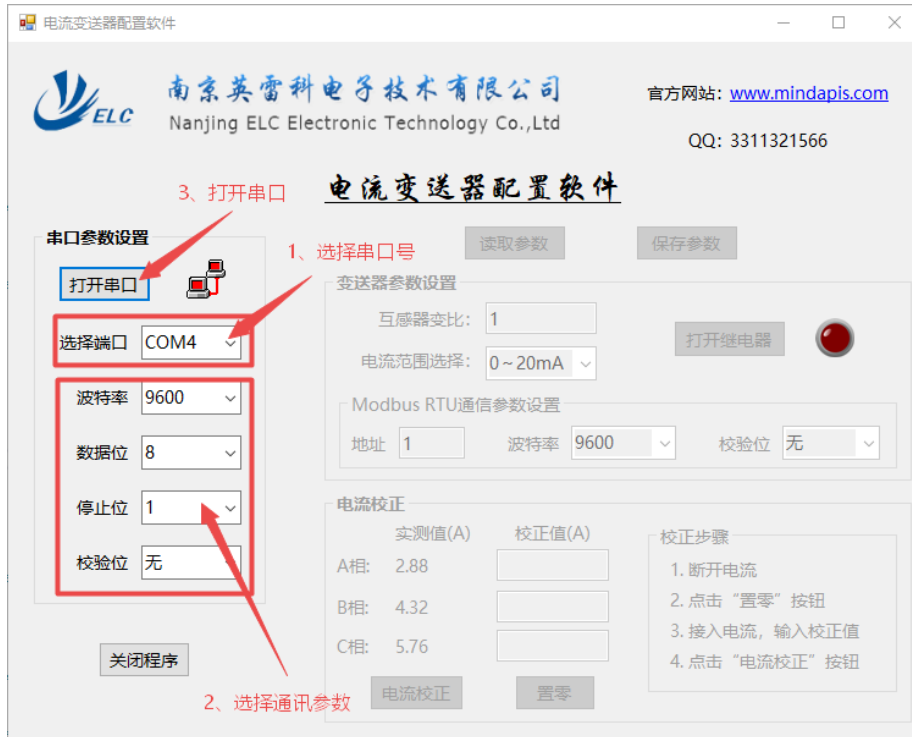
图 4 变送器通讯连接

打开电流变送器配置软件 EIS-3C-SETTING，如图 4，选择串口号，并核对软件界面左侧电脑的通信参数是否和变送器一致，变送器默认通信参数：波特率：9600，数据位：8，停止位：1，校验位：无。